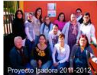
Proyecto Isadora 2011-2012