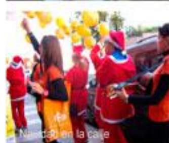
Navidad en la calle