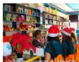
Visita a empresas en Navidad