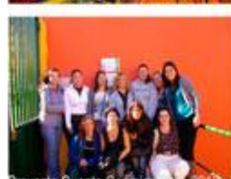
Proyecto Cuenta Conmigo 2011-2012