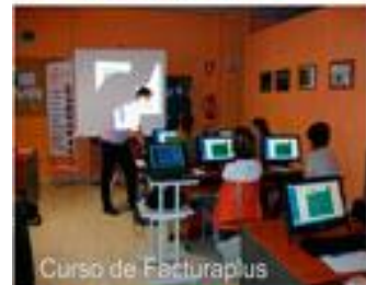
Curso de Facturaplus