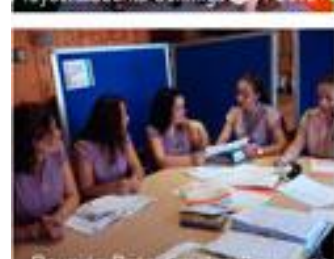
Reunión Dpto. Empleo Emp. 548